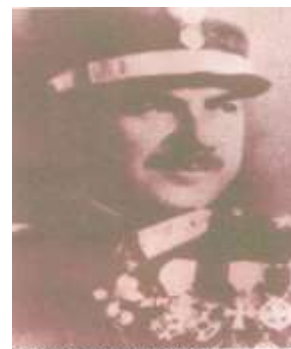
Ο Υποστράτηγος Χ. Κατσιμήτρος

Κατά τον Ελληνοϊταλικό Πόλεμο του 1940 η VIII Μεραρχία, με Διοικητή τον Υποστράτηγο Χαράλαμπο Κατσιμήτρο, έγραψε στην Ιστορία της σελίδες άφθαστου μεγαλείου και δόξας.