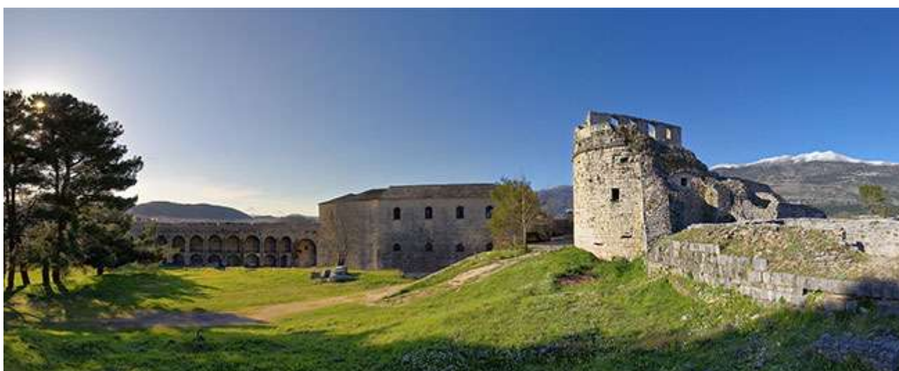
«Η Ακρόπολη του Κάστρου Ιωαννίνων»