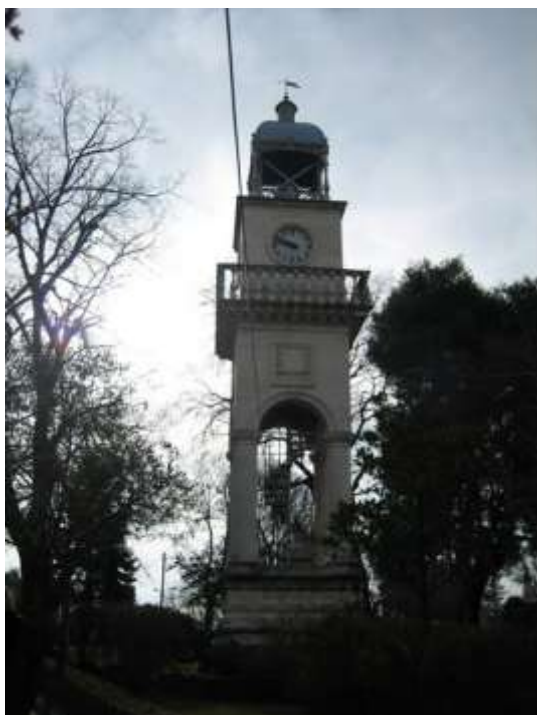
«Το Ρολόι Ιωαννίνων»