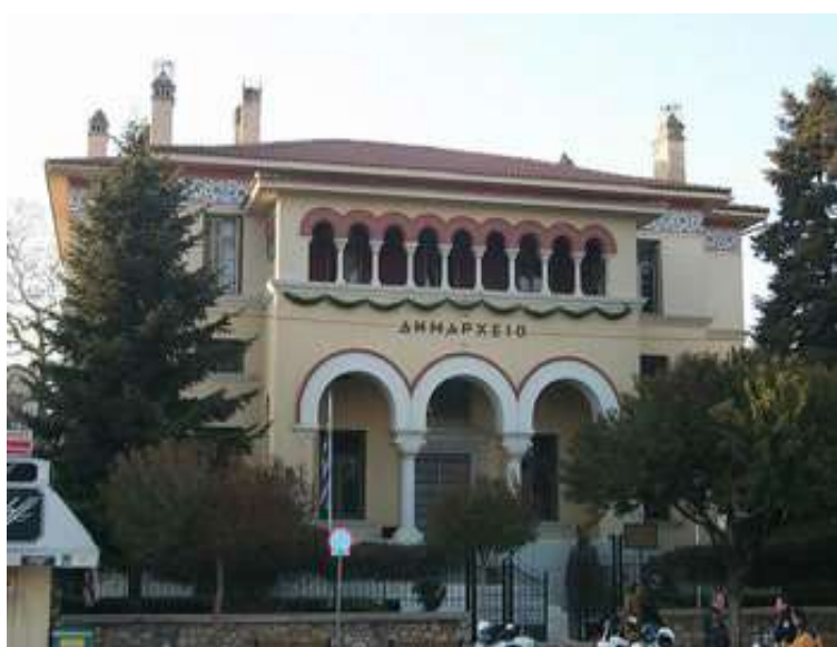
«Το Δημαρχείο Ιωαννίνων»