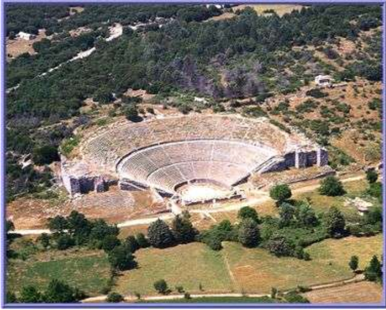
« Το αρχαίο θέατρο Δωδώνης »