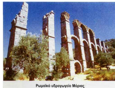
Ρωμαϊκό υδραγωγείο Μόριας