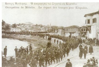
Ο απελευθερωτικός στρατός το 1912

στο νησί και φωτίζουν από πολλές απόψεις το βίο των νησιωτών κατά τους σκοτεινούς αυτούς αιώνες. Στις 8 Νοεμβρίου 1912, ο ναύαρχος Κουντουριώτης με μοίρα του ελληνικού στόλου καταλαμβάνει την πόλη της Μυτιλήνης και ένα μήνα αργότερα η Ελληνική νίκη επισφραγίζεται με αιματηρή μάχη και απελευθερώνεται τελικά ολόκληρη η Λέσβος. Μετά τη Μικρασιατική εκστρατεία του 1922, περίπου 24.000 πρόσφυγες, εγκαθίστανται μόνιμα στο νησί. Η Λέσβος θα γνωρίσει μία ακόμη περίοδο κατοχής κατά το Δεύτερο Παγκόσμιο Πόλεμο, όταν Γερμανικά στρατεύματα την καταλαμβάνουν το 1941. Η κατοχή διαρκεί ως το 1944. Το 1975 συστήνεται η 98 ΑΔΤΕ, Σχηματισμός του Ελληνικού Στρατού, και κατά την επόμενη δεκαετία ιδρύονται το Πανεπιστήμιο και το Υπουργείο του Αιγαίου στην πόλη της Μυτιλήνης. Σημαντική είναι η πνευματική δημιουργία των λογίων και καλλιτεχνών από τη Λέσβο κατά τον τελευταίο αιώνα. Κορυφαίοι αναδεικνύονται οι λογοτέχνες Αργύρης Εφταλιώτης (1849-1923), Στρατής Μυριβήλη (1890-1969), Ηλίας Βενέζης (1914-1973), ο ποιητής Οδυσσέας Ελύτης (1911-1996) και ο λαϊκός ζωγράφος Θεόφιλος Χατζημιχαήλ (1873-1934), τα έργα του οποίου στεγάζονται σε ιδιαίτερο μουσείο κοντά στην Μυτιλήνη.