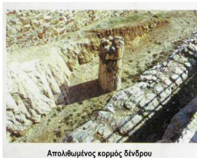
Απολιθωμένος κορμός δένδρου

Σαπφώ από την Ερεσό και τον Αλκαίο από τη Μυτιλήνη και οι δύο αριστοκρατικής καταγωγής και αντίπαλοι του Πιπτακού.