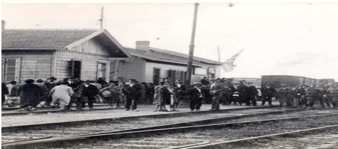
Σιδηροδρομικός Σταθμός Σουφλίου

Με τη διέλευση της σιδηροδρομικής γραμμής, που ένωσε την Ευρώπη με την Κωνσταντινούπολη και τη δημιουργία του σιδηροδρομικού σταθμού το 1870, άρχισε η μεγάλη ακμή του Σουφλίου. Το 1877 σε έκθεση για την κατάσταση των σχολείων αναφέρεται ότι το Σουφλί ήταν κωμόπολη ελληνική με 1200 οικογένειες. Είχε δυο σχολεία με δύο τμήματα το καθένα, το συνδιδακτικό και το αλληλοδιδακτικό.