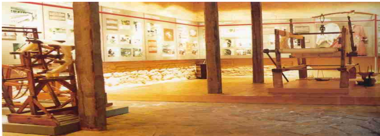
Εσωτερική αρχιτεκτονική του Μουσείου μεταξιού

Το Μουσείο Μετάξης στο Σουφλί παρουσιάζει όλες τις φάσεις και τα στάδια από την προβιομηχανική διαδικασία της εκτροφής των μεταξοσκωλήκων (σηροτροφία) και της επεξεργασίας του μεταξιού (μεταξουργία), μέσα στο κοινωνικό-οικονομικό πλαίσιο που ανέδειξε την περιοχή ως σημαντικό μεταξοπαραγωγικό κέντρο της Ελλάδας (τέλη 19ου-μέσα 20ού αι).