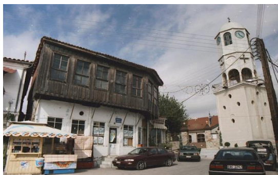
Παραδοσιακό Ξύλινο Καφενείο