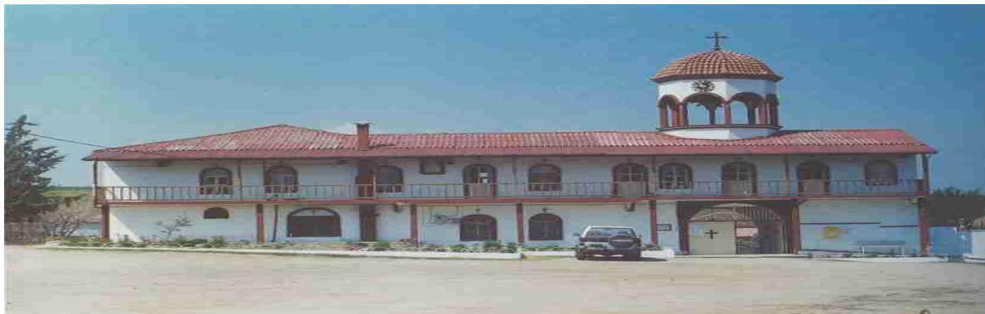
Μοναστήρι Κορνοφωλιάς Παναγίας Πορταΐτισσας

Νότια της πόλης, στο δρόμο της Αλεξανδρούπολης συναντάμε το χωριό Κορνοφωλιά. Το χωριό ονομάστηκε έτσι από τις πολλές κουρούνες που φώλιαζαν στα δέντρα. Ο δρόμος από την πλατεία του χωριού, οδηγεί σε εξαιρετικά καταπράσινη πλαγιά, με σπάνιο φυσικό κάλλος, στην κορυφή του λόφου, όπου βρίσκεται το Μοναστήρι της Παναγίας της Πορταΐτισσας. Ιδρύθηκε πριν τον 17 ο αιώνα σε θέση όπου υπήρχε παλαιότερα άλλο Μοναστήρι.