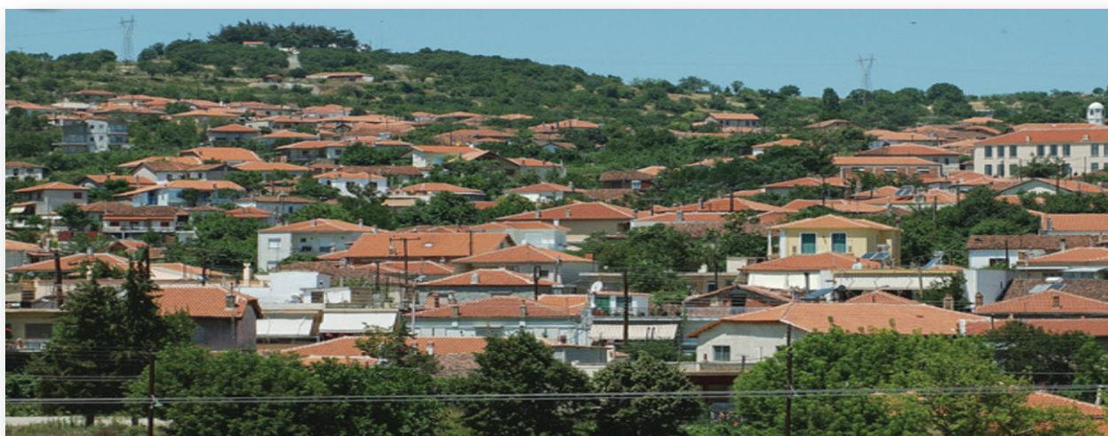
Πανοραμική άποψη Σουφλίου

Είναι χτισμένο στην ανατολική πλαγιά του δίδυμου λόφου του προφήτη Ηλία (Αϊ-Λιά), ενός από τα τελευταία υψώματα της οροσειράς Ροδόπης. Βρίσκεται στο κέντρο του Νομού Έβρου, καθώς απέχει 65 χλμ από την Αλεξανδρούπολη (νότια) και 50 χλμ. από την Ορεστιάδα (βόρεια). Ως Δήμος Σουφλίου έχει πληθυσμό 14.941 κατοίκων (απογραφή 2011) και αποτελείται από τρεις «δημοτικές ενότητες» Σουφλίου, Ορφέα, Τυχερού οι οποίες ήταν αυτόνομοι δήμοι πριν την εφαρμογή του προγράμματος «Καποδίστρια».