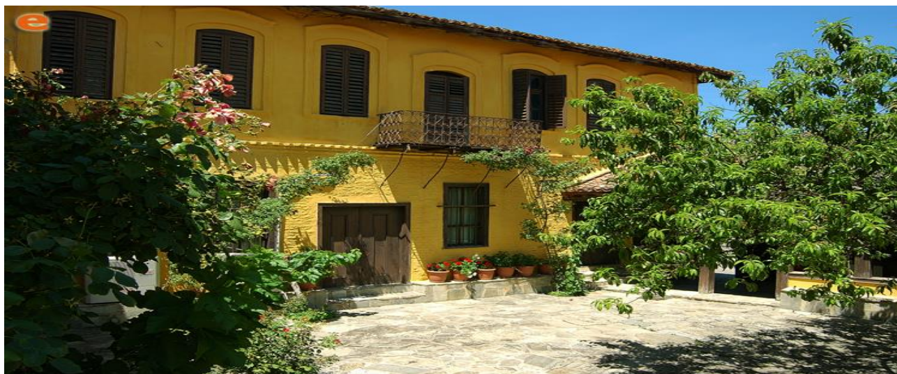
Εξωτερική αρχιτεκτονική του Μουσείου μεταξιού

Στον όροφο αναπτύσσεται το σενάριο της έκθεσης, που αφορά τη σηροτροφία . Η πορεία του επισκέπτη ακολουθεί τον κύκλο της σηροτροφίας. Ξεκινά από την παραγωγή και εκκόλαψη του σπόρου, τη μουριά και τον μεταξοσκώληκα, συνεχίζεται με τα στάδια ανάπτυξης του μεταξοσκώληκα (ηλικίες) και την ύφανση του πολύτιμου κουκουλιού (κλάδωμα και ξεκλάδωμα).