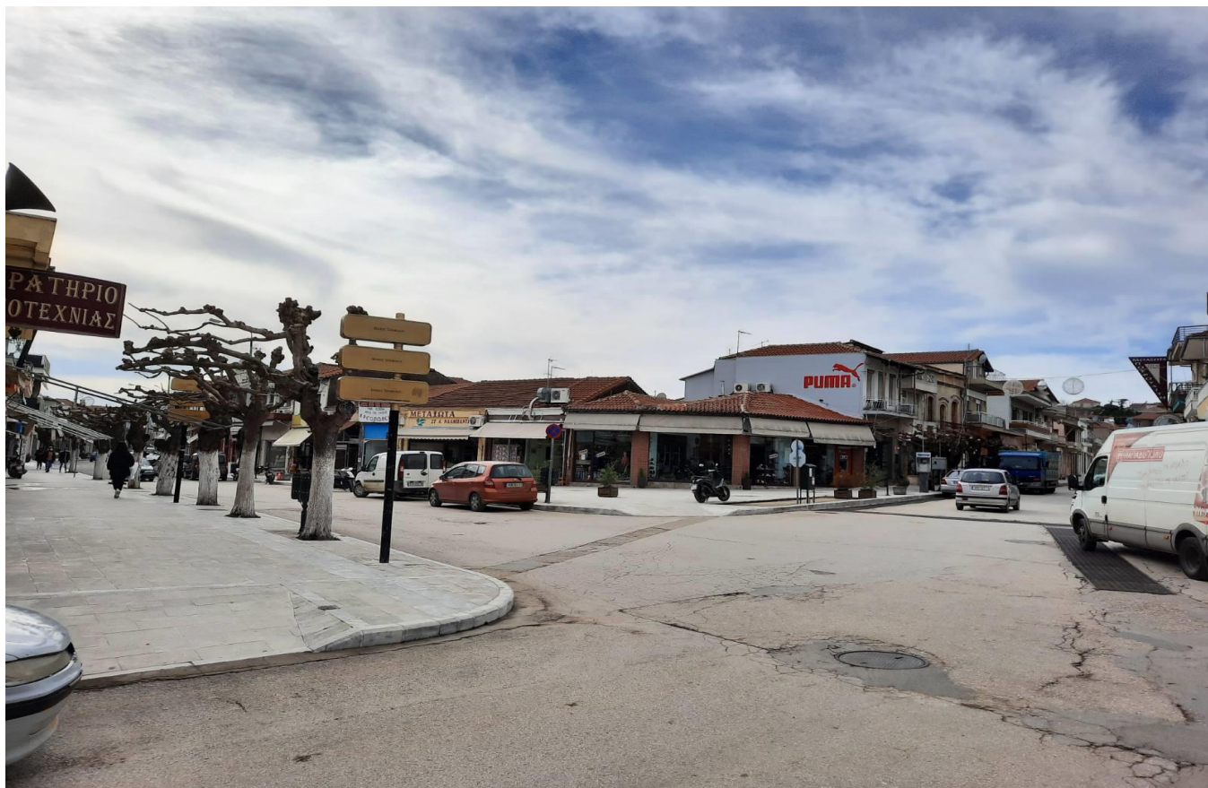
Κέντρο της Πόλης

Στην αγορά του Σουφλίου που βρίσκεται στην κεντρική οδό Βασιλέως Γεωργίου θα αγοράσετε μεταξωτά προϊόντα κάθε είδους, νόστιμα εδέσματα, βασισμένα στο κρέας και στις γεύσεις της αμπέλου, το τσίπουρο και το κρασί, τα διάσημα στην περιοχή από τους περιηγητές των χρόνων της Τουρκοκρατίας.