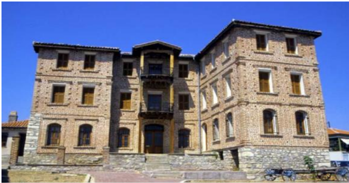
Σουφλί, Αρχοντικό Μπρίκα

Μαζί με τους Ηπειρώτες και οι Θεσσαλοί έφεραν εκτός από τις οικονομίες τους, τα ήθη και τα έθιμά τους, τα φαγητά τους, τη γλωσσική διάλεκτο, τις φορεσιές τους, τους χορούς και τα τραγούδια τους. Ακόμα και το κτίσιμο των σπιτιών γινόταν σύμφωνα με την παραδοσιακή ηπειρώτικη τεχνοτροπία (οικία Μαυρουδή Μπρίκα).