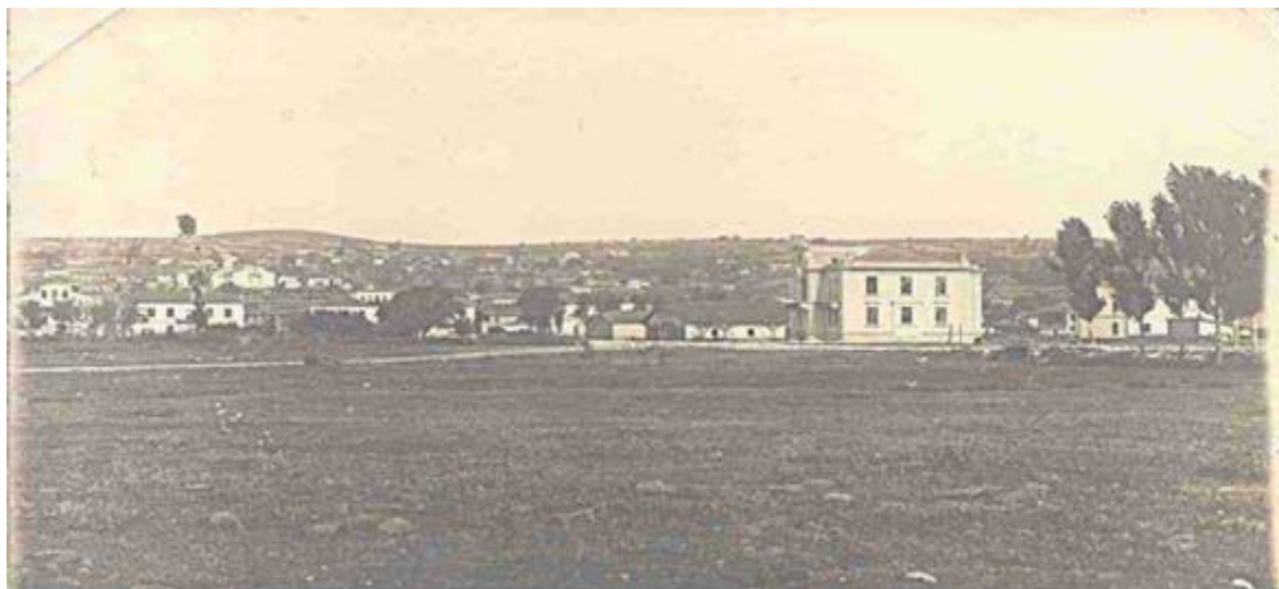
Γενική άποψη Σουφλίου, πριν από το 1920

Γι' αυτό οι Τούρκοι το Σουφλί το ονόμαζαν Sufili, Sofulu και Sofilou. Η γύρω περιοχή είναι διάσπαρτη από ευρήματα που μαρτυρούν την ύπαρξη ζωής από τους προχριστιανικούς χρόνους (Παλαιόκαστρο, Γιάτσιος, Γκιριτζή κ.λ.π.)