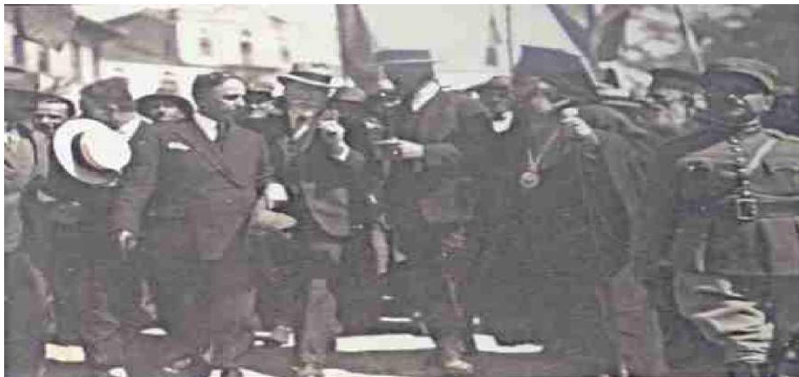
Ο Ελευθέριος Βενιζέλος μαζί με τον Δήμαρχο και τον Μητροπολίτη Σουφλίου (07-05-1930)