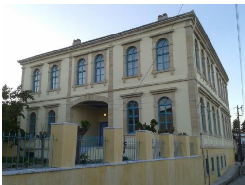
Παλιό 1 ο Δημοτικό Σχολείο