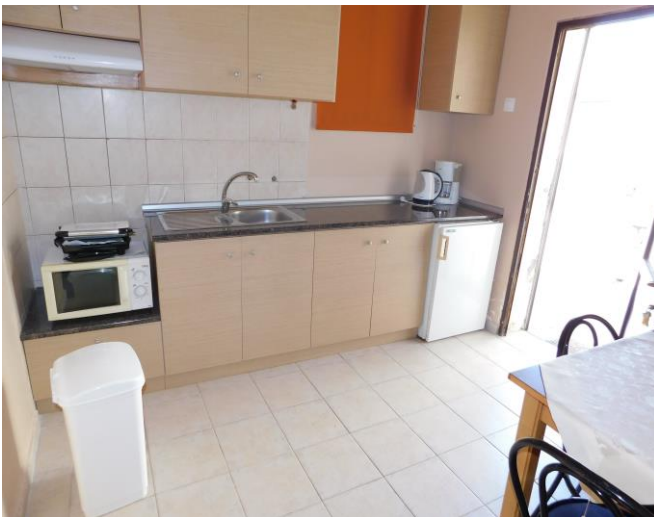
Εσωτερική διαμόρφωση ξενώνα