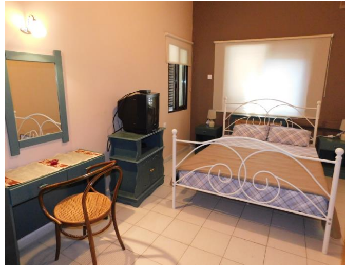
Εσωτερική διαμόρφωση ξενώνα