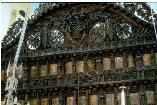
Τέμπλο Ιερού Ναού Αγ. Γεωργίου