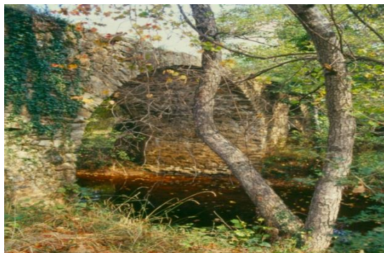
Παλιό Γεφύρι Γιαννούλης