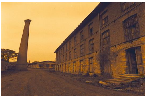
Παλιό Μεταξουργείο Τζιβρε