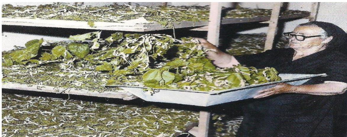
Τάισμα των μεταξοσκώληκων

Η ιστορία του Σουφλίου είναι άμεσα συνδεδεμένη με το μετάξι, τους δύο τελευταίους αιώνες, γεγονός που έπαιξε αποφασιστικό ρόλο στην οικονομική και πολιτιστική ανάπτυξη της περιοχής. Για αυτό το Σουφλί είναι γνωστό ως «πόλη του μεταξιού». Είναι ακόμη φημισμένο για το κρασί, το τσίπουρο και τα αλλαντικά, καθώς επίσης για την πλούσια παράδοση και την πολιτιστική του κληρονομιά.