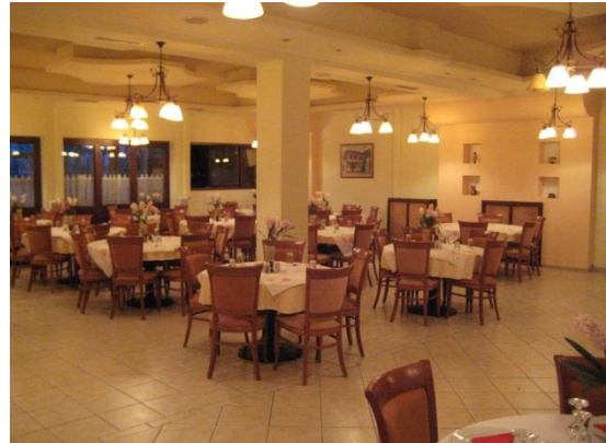
Εσωτερικό ΛΑΦ Σουφλίου

Βρίσκεται παραπλεύρως του ΑΤ Σουφλίου ,λειτουργεί καθημερινά και εξυπηρετεί το σύνολο των Στελεχών της Φρουράς, σε καθημερινή βάση με συσσίτιο και φαγητά της ώρας.