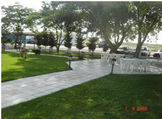
Κήπος της ΛΑΦ Σουφλίου