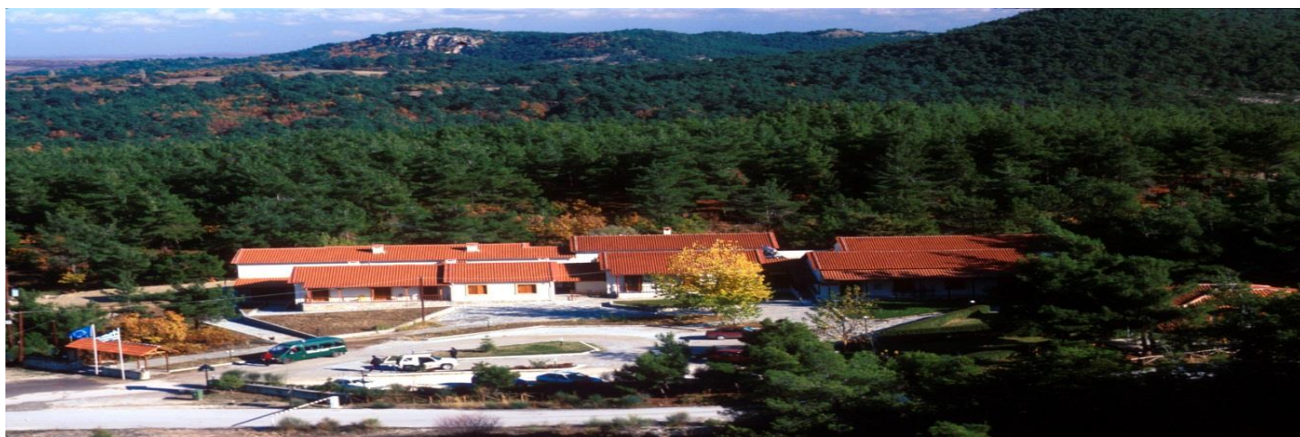
Τουριστικό κέντρο ενημέρωσης Δαδιάς

Η Δαδιά παρουσιάζει ιδιαιτερότητα γιατί συγκεντρώνει σχεδόν όλα τα αρπακτικά και άγρια ζώα, που έχουν εξαφανιστεί από τη γηραιά Ήπειρο ή βρίσκονται σε άμεσο κίνδυνο εξαφάνισης.