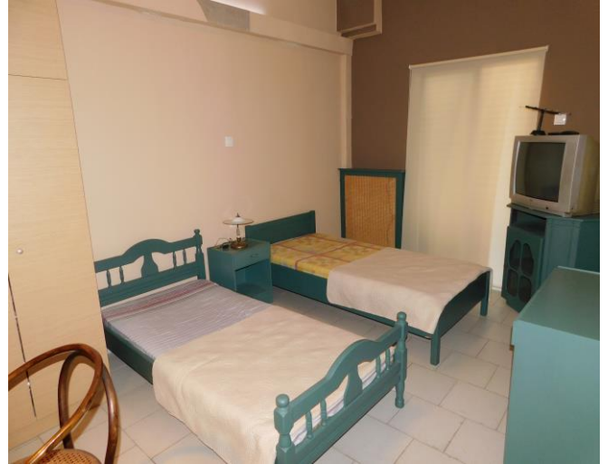
Εσωτερική διαμόρφωση ξενώνα