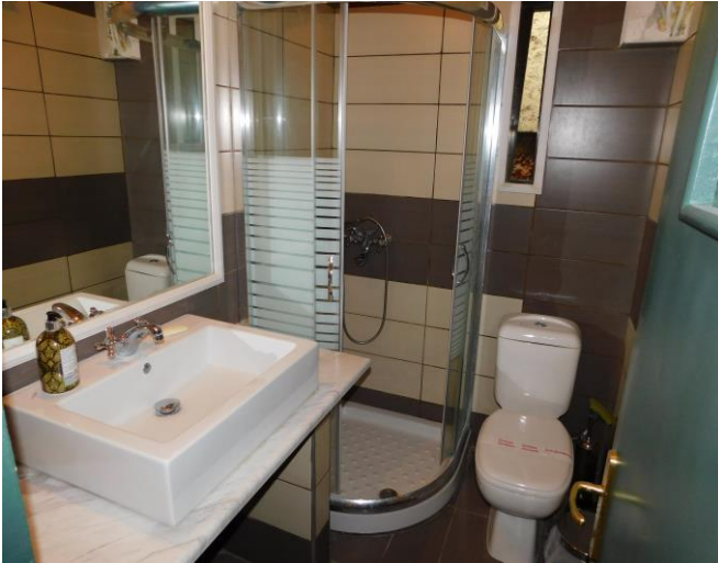
Εσωτερική διαμόρφωση ξενώνα

Στο πλαίσιο της παροχής διευκολύνσεων σε επισκέπτες - φιλοξενούμενους της 50 Μ/Κ ΤΑΞ «ΑΨΟΣ», διατίθενται ένας ξενώνας 40 τμ ο οποίος βρίσκεται πλησίον του Στρατοπέδου «ΜΗΛΙΔΩΝΗ».