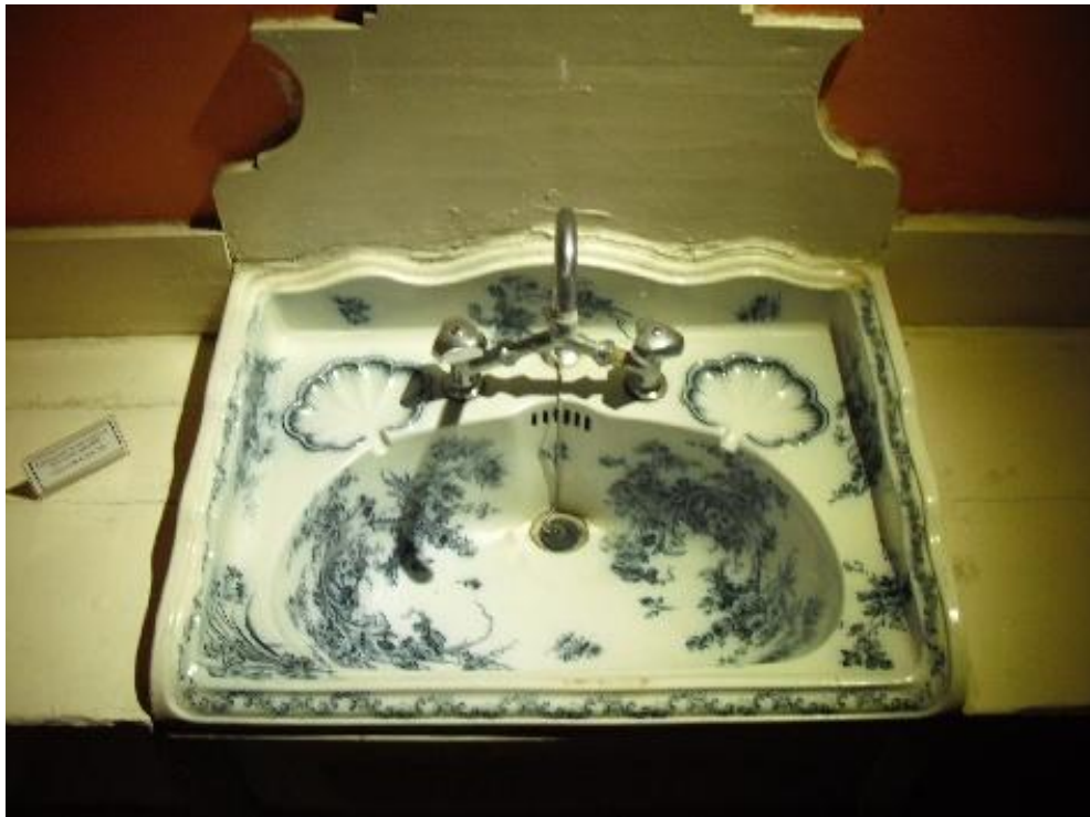
Νιπτήρας από πορσελάνη φαγεντιανής

Η δεύτερη κρεβατοκάμαρα βρίσκεται δίπλα ακριβώς και είναι το μέρος όπου βρίσκονται αντίγραφα των στολών του ελληνικού στρατού που μετείχε στον πόλεμο. Και εδώ ξεχωρίζει το λουτρό και ο νιπτήρας ο οποίος είναι ακόμα πιο καλαίσθητος από τον πρώτο, επίσης από πορσελάνη φαγεντιανής.