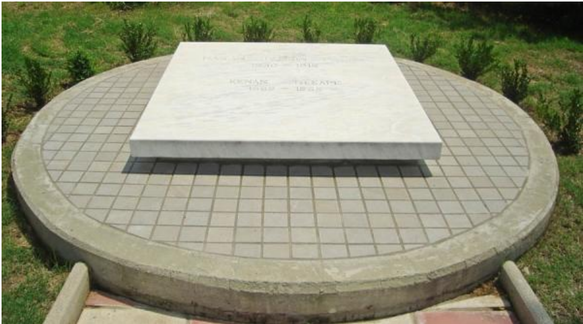
Το ταφικό μνημείο του Χασαν Ταχσίν πασά και του γιου του Κενάν Μεσαρέ

Μετά την ολοκλήρωση των εργασιών του Μουσείου το 2000 ο Β. Νικόλτσιος μεταφέρει τα οστά Χασάν Ταχσίν και του Κενάν Μεσαρέ και τα εναποθέτει σε ένα ταφικό μνημείο σχεδιασμένο από τον Σαχίν- Σεργιο Μεσαρέ (εγγονό του πασά) που δημιουργήθηκε ειδικά γι αυτό το λόγο στον προαύλιο χώρο του Μουσείου.