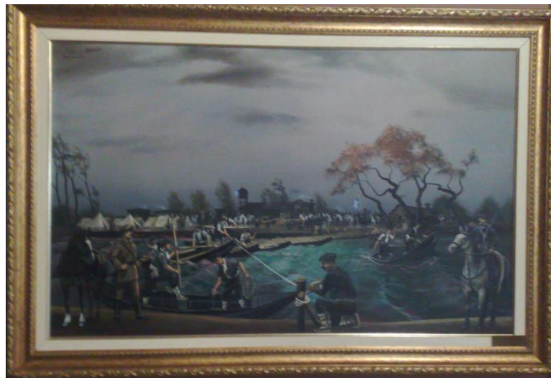
Ελαιογραφία της διάβασης του Αξιού μέσω λεμβοζευκτης γέφυρας (δωρεά κ. Φ. Φράγκου)

Τα έπιπλα είναι γαλλική προέλευσης των αρχών του 20ου αιώνα ενώ στο τοίχο έχουμε αντίγραφα επιστολικών δελταρίων καθώς και ένα ζωγραφικό πίνακα (δωρεά του κ. Φράγκου) όπου αναπαριστάται η διέλευση του Αξιού Ποταμού μέσω της λεμβόζευκτης γέφυρας.