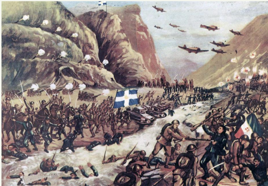
Εικόνα 2: Η μάχη στον ποταμό Καλαμά σε λαϊκή εικόνα της εποχής (Ιστορία του Ελληνικού Έθνους, τ. ΙΕ', Εκδοτική Αθηνών, Αθήνα ..., σ. 425).

Η VIII Μεραρχία είχε ενισχυθεί με το Στρατηγείο της III Ταξιαρχίας Πεζικού και μερικές μονάδες Πεζικού και Πυροβολικού. Οι δυνάμεις της περιλάμβαναν τέσσερις διοικήσεις συνταγμάτων Πεζικού, 15 τάγματα Πεζικού, 15 πυροβολαρχίες, 5 ουλαμούς συνοδείας πεζικού, 2 τάγματα πολυβόλων κίνησης, και 1 μεραρχιακή ομάδα αναγνώρισης. Ο