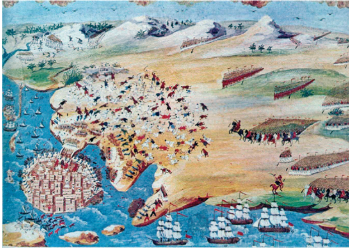
Πολιορκία Μεσολογγίου (1826)

Η μετατροπή των χιλιαρχιών σε Τάγματα δεν υπήρξε μια απλή οργανωτική αλλαγή, αλλά μια πολύμηνη και επίμονη διαδικασία, κατά την οποία αναδείχθησαν αντικρουόμενα συμφέροντα και επιδιώξεις. Ο Καποδίστριας έχοντας επιτύχει την εκδίωξη των Οθωμανών από το μεγαλύτερο μέρος της Στερεάς πίστευε πως έπρεπε να αναδιοργανώσει και πάλι τα στρατιωτικά σώματα. Η προγενέστερη μορφή τους -η Χιλιαρχία - δεν θεωρείτο πλέον αναγκαία, αφού ο τελικός καθορισμός των συνόρων θα επερχόταν μέσω της διπλωματικής οδού. Τα Ελαφρά Τάγματα με λειτουργικότερο κανονισμό σε σχέση με αυτόν των Χιλιαρχιών και με σαφώς μειωμένο αριθμό ανδρών (6.000) ήταν από πολιτικής και οικονομικής άποψης μια θετική ενέργεια. Μέσω αυτής της αλλαγής η Κυβέρνηση μπόρεσε να απαλλαγεί και πάλι από αρκετούς χιλιαρχους, οι οποίοι αρνήθηκαν να δεχτούν το βαθμό του ταγματάρχη 38 . Συγχρόνως δημιουργήθηκαν νέα επιτελεία και επιτροπές επιθεώρησης, οργανώθηκε καλύτερα η επιμελητεία του στρατού και συγκροτήθηκαν στρατιωτικά δικαστήρια 39 .