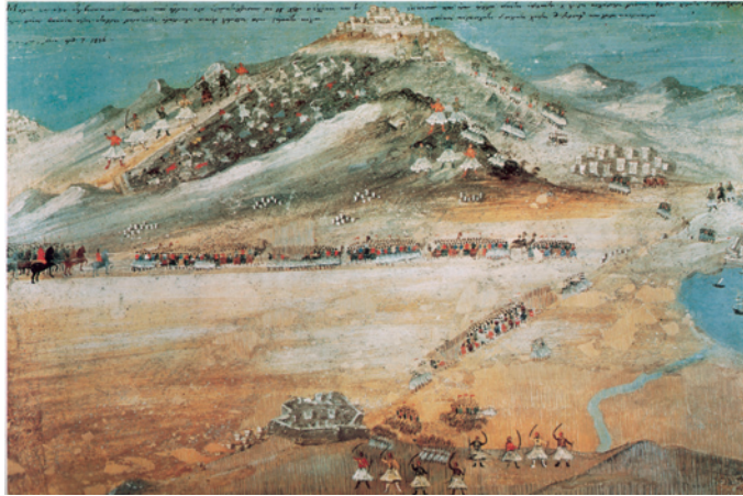
Μάχη στα Δερβενάκια

Ο Κυβερνήτης στο πλαίσιο της οικονομικής πολιτικής του για το στρατό πέτυχε να εξασφαλίσει μηνιαία χορηγία 500.000 φράγκων από τη Γαλλία και 500.000 ρούβλια από τη Ρωσία. Επιπρόσθετα ο βασιλιάς της Γαλλίας Κάρολος Ι΄ χορηγούσε μηνιαίως 100.000 γαλλικά φράγκα για τις ανάγκες συντήρησης του Τακτικού Σώματος . Επί Καποδίστρια τέλος, δημοσιεύθηκε πίνακας εξόδων του κρατικού προϋπολογισμού (11.7.1829) 109 . Τα χρήματα που παρείχε η Γαλλία κατατίθονταν σε ειδικό ταμείο, το οποίο διαχειριζόταν τριμελής επιτροπή με μέλη το Γραμματέα Στρατιωτικών και Ναυτικών , το Διευθυντή του Τακτικού Σώματος και το Γάλλο διατάκτη 110 . Άλλα διοικητικής μέριμνας όργανα -υπεύθυνα κυρίως για τη Δυτική και Ανατολική Στερεά Ελλάδα- ήταν ο Διευθυντής ή Επιστάτης Τροφών , οι Επιθεωρητές Τροφών με έδρα τη Ναύπακτο και το Μεσολόγγι, οι Επιστάτες και Επιθεωρητές Αποθηκών με έδρα τη Σαλαμίνα, τη Βόνιτσα, την Αταλάντη, τις Θερμοπύλες, οι Ταμίες με έδρα τη Σαλαμίνα, τη Ναύπακτο, τη Βόνιτσα, την Αταλάντη και τις Θερμοπύλες. Στο Ναύπλιο τέλος έδρευε και η Εξεταστική Επιτροπή των Στρατιωτικών Λογαριασμών .