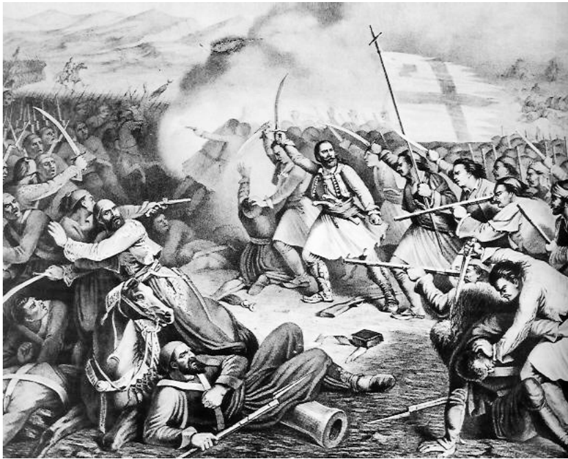
Μάχη στο Μανιάκι (20 Μαΐου 1825)