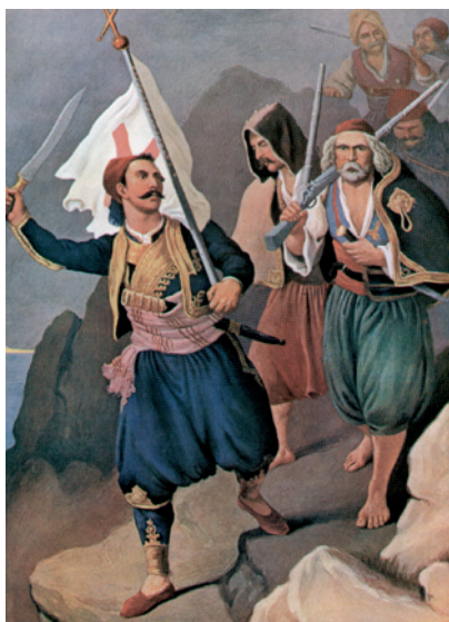
Απελευθέρωση της Καλαμάτας (23 Μαρτίου 1821)

Στα μέσα του 1829 ιδρύθηκε και το Σώμα των επί της Οχυρωματοποιίας και Αρχιτεκτονικής Αξιωματικών (Μηχανικό), το οποίο ασχολείτο με τις επισκευές στα οχυρώματα και τα στρατιωτικά κτήρια και όσες άλλες εργασίες ήταν στα καθήκοντα των αρχιτεκτόνων. Το όργανο κρίθηκε αναγκαίο για τη συντήρηση και επισκευή των φρουριών και την ανέγερση κτηρίων στα οποία θα στεγάζονταν στρατιωτικοί και δημόσιες υπηρεσίες. Με τη σύσταση του εν λόγω σώματος οποιαδήποτε οικοδομική ή επισκευαστική εργασία θα πραγματοποιείτο υποχρεωτικά από το σώμα της Οχυρωματοποιίας ή υπό τη διεύθυνσή του (28.7.1829) 52 .