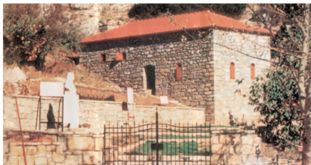
Λιμποβίσι. Οικία Θ. Κολοκοτρώνη

Ο Κυβερνήτης ζητά στατιστικά στοιχεία για τη δύναμη του ελληνικού και του εχθρικού στρατού (23.1.1828-28.7.1829). Οδηγίες του Καποδίστρια προς τον Αυγουστίνο για εκκαθαρίσεις στα ελληνικά στρατεύματα (22.2.1829).