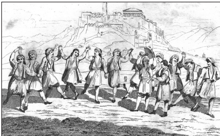
Ψυχαγωγία στρατιωτών κάτω από την Ακρόπολη (1828)

Ch. Fabvier 6 , ή να εντάξει τους ατάκτους σε ημιτακτικούς σχηματισμούς, μετατρέποντάς τους βαθμιαία σε τακτικούς. Τελικά επέλεξε τη δεύτερη λύση, προσπαθώντας να ελαχιστοποιήσει τις οποιεσδήποτε κοινωνικές και πολιτικές συνέπειες που θα επέφερε η διάλυση των ατάκτων 7 .