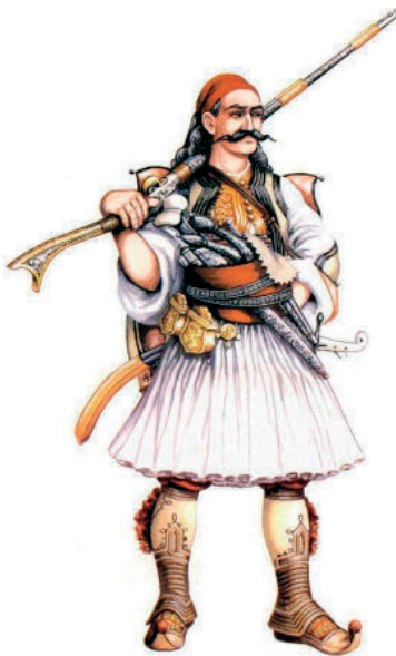
Στρατιώτης Τακτικού Σώματος

αναφορές, οι δε διδάσκαλοι αξιωματικοί έπρεπε να τους διδάσκουν την αρετήν και την μετά λόγου πειθαρχίαν . Οι πρώτοι Ευέλπιδες λάμβαναν μια μερίδα ψωμί, σιτηρέσιο και τέσσερα ισπανικά δίστηλα το μήνα ως μισθό. Οργανωτής και πρώτος διοικητής του Λόχου των Ευελπίδων ήταν ο Κορσικανός R. Santelli 95 . Η πρώτη προσπάθεια εκπαίδευσης απέτυχε λόγω της ανεπάρκειας του Santelli, της έλλειψης καθηγητών και υποδομής, της ακαταλληλότητας των πρώτων σπουδαστών και της απροθυμίας των προκρίτων και των σπλαρχηγών να στείλουν τα παιδιά τους στο Λόχο Ευελπίδων για εκπαίδευση, επειδή θεωρούσαν την πειθαρχία που εφαρμοζόταν εκεί ως ταπεινωτική.