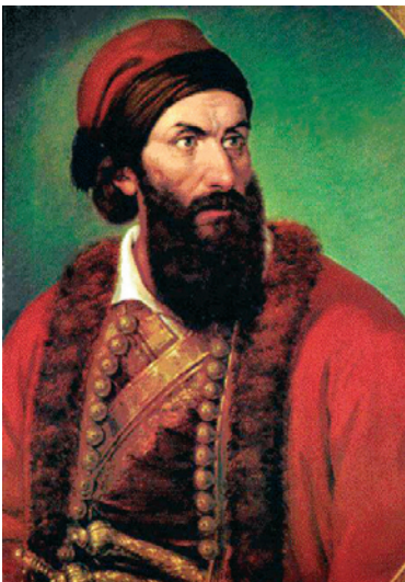
Γρηγόριος Δικαίος ή Παπαφλέσσας