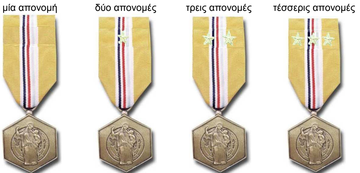
Διαμνημόνευση Συμμετοχής σε Ειρηνευτικές Αποστολές

Σε περίπτωση πολλαπλών απονομών, φέρεται μόνο ένα διάσημο και αντίστοιχα μία διεμβολή στο χιτώνιο. Για τη διάκριση των πολλαπλών απονομών, φέρεται στην ταινία του διασήμου ή στη διεμβολή, ένας επάργυρος αστερίσκος , για κάθε νέα απονομή, μέχρι του αριθμού των τριών.