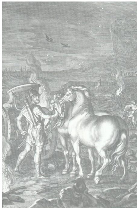
Η αρπαγή των αλόγων του βασιλιά των Θρακών Ρήσου από τον Οδυσσέα και το Διομήδη.

Χωρίς λοιπόν αμφιβολία, μπορούμε οι σύγχρονοι Έλληνες να υπερηφανευόμαστε, ότι η πατρότητα της ιδέας της καταδρομής ως προς τη σύλληψη, αλλά και ως προς τη σχεδίαση και εκτέλεση, είναι καθαρά Ελληνική.