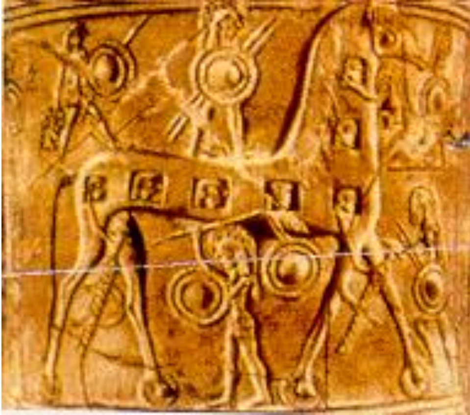
Ο “Δούρειος Ἴππος” από Ελληνικό αγγείο του 5ου αι. π.Χ.

«...τόφρα δ' ἄρ' ὁ τλήμων Ὀδυσσεύς λύε μώνυχας ἵππους, σύν δ' ἤειρεν ἱμάσι καὶ ἐξήλαυεν ὀμίλου...»