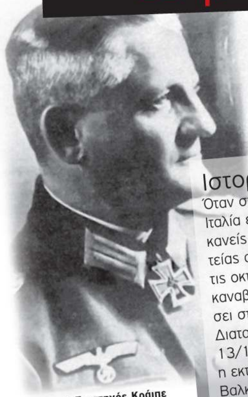
Ο Στρατηγός Κράιπε