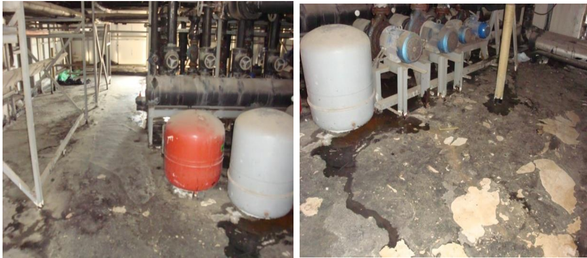
Εικόνα 3, 4, 5 και 6 του δώματος

(1) Στις περιπτώσεις του δώματος όπου δεν είναι δυνατή η εφαρμογή ασφαλτοπάνων (σε μη προσβάσιμα σημεία, όπως κάτω από βαριά μηχανήματα ή σωληνώσεις, που δεν μπορούν να αποξηλωθούν προσωρινά) θα εφαρμοστεί συνδυαστικά το σύστημα του ασφαλτικού επαλειπτικού στεγανωτικού συστήματος ενδεικτικού τύπου ESHAELASTIC ή αναλόγου και σε απόλυτη συναρμογή με τις απολήξεις των ασφαλτικών μεμβρανών. Προς τούτο θα εκτελεστούν οι παρακάτω εργασίες: