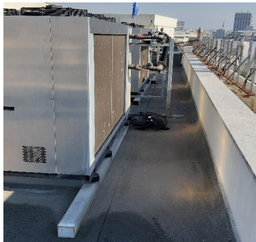
Εικόνα 1, 2 (Μπροστινή όψη του δώματος)

γ. Η επισκευή και αποκατάσταση του υπόψη δώματος, θα γίνει: