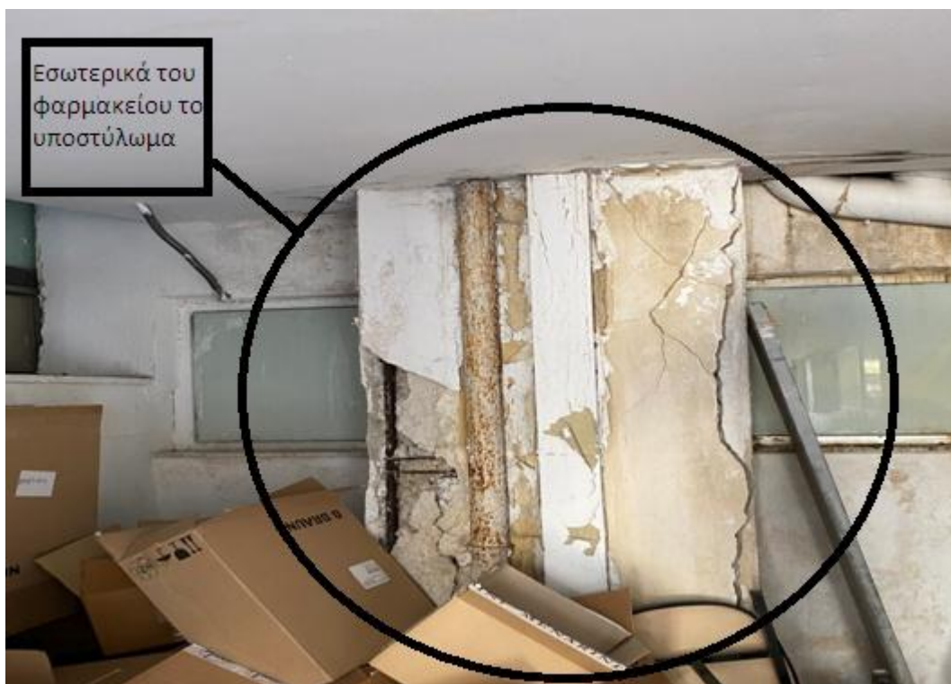
Εικόνα 4: Εσωτερικά του φαρμακείου το υποστύλωμα