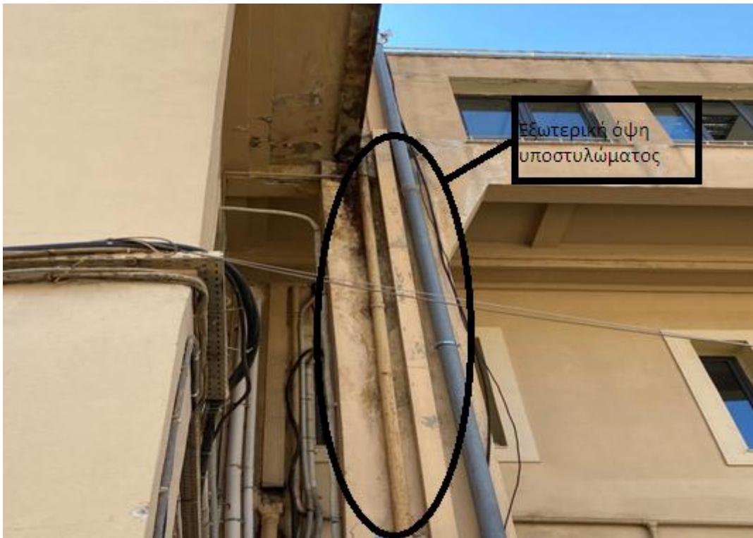
Εικόνα 2: Εξωτερική όψη υποστυλώματος