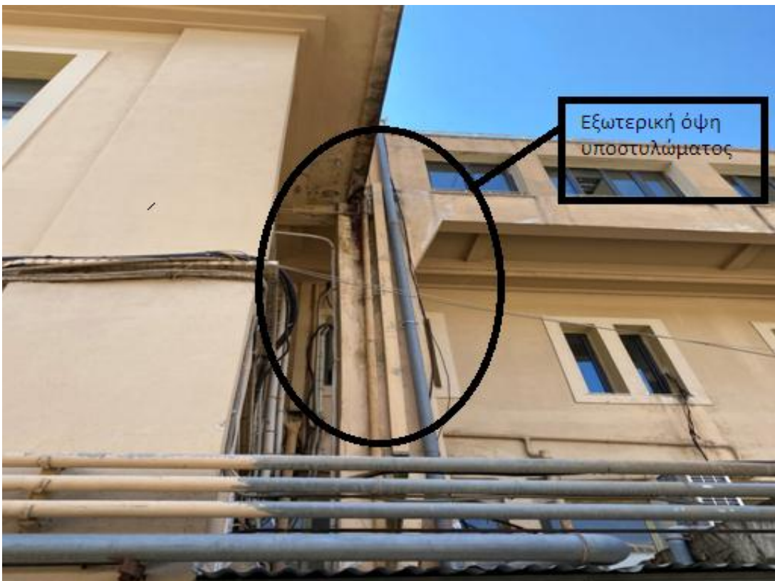
Εικόνα 1: Εξωτερική όψη υποστυλώματος

Παρακάτω παρουσιάζονται ενδεικτικές φωτογραφίες από το πρόβλημα στατικότητας του υποστυλώματος, το οποίο εδράζεται στο χώρο του Φαρμακείου του Νοσοκομείου.