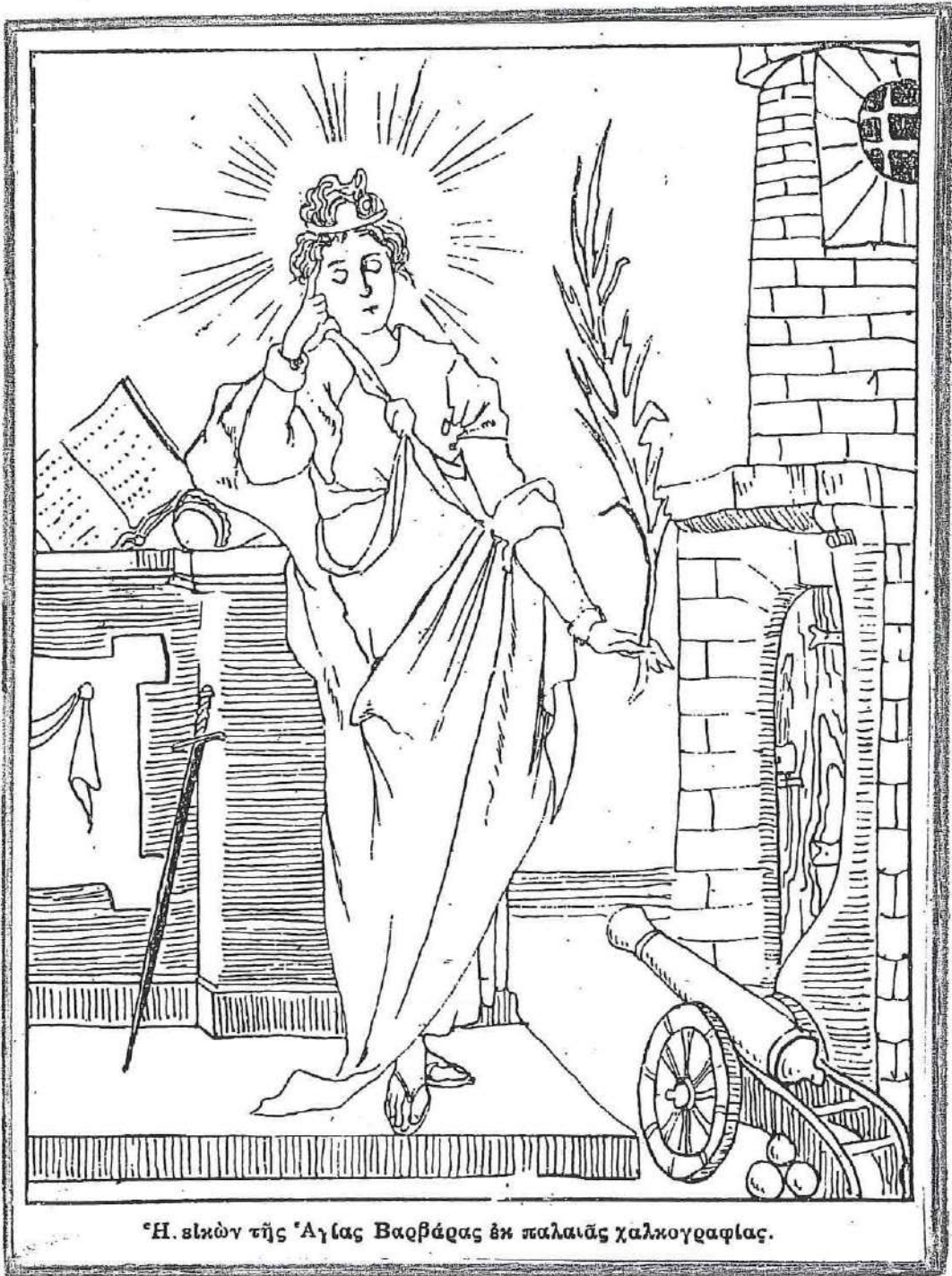
• Η εικόνη τῆς Ἁγίας Βαρβάρας ἐκ παλαιᾶς χαλκογραφίας.

Φωτ. Υπουργείου Στρατιωτικῶν: "ΜΕΓΑΛΗ ΣΤΡΑΤΙΩΤΙΚΗ ΚΑΙ ΝΑΥΤΙΚΗ ΕΓΚΥΚΛΟΠΑΙΔΕΙΑ" Αθήναι 1927-30.