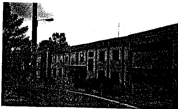
Εικόνα 1 Εξωτερική άποψη της κεραμοσκεπής

Με αυτό τον τρόπο εξοικονομείται ενέργεια, καθώς γίνεται εκμετάλλευση της ηλιακής ενέργειας, και εξοικονομούνται πόροι. Εκτιμάται ότι η απόσβεση του κόστους θα πραγματοποιηθεί εντός λίγων ετών.