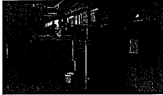
Εικόνα 3 Υφιστάμενο σύστημα θέρμανσης νερού