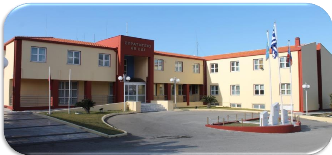
Εικόνα 2_Άποψη του Στρατηγείου της Ταξιαρχίας

Από το Μάρτιο 2005 το Στρατηγείο της 88 ΣΔΙ «ΛΗΜΝΟΣ», στεγάζεται σε σύγχρονες εγκαταστάσεις στο 1 ο χλμ. της επαρχιακής οδού Μύρινας - Μούδρου.