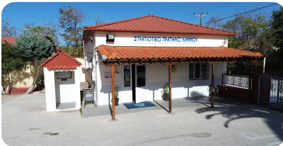
Εικόνα 7_ΣΠ Λήμνου

Στη Φρουρά Λήμνου λειτουργεί, πλησίον της ΛΑΦ Μύρινας, Στρατιωτικό Πρατήριο (Στρατόπεδο «ΑΝΘΛΓΟΥ ΤΣΙΜΟΥΡΗ»), στην περιοχή «Ρωμείκος Γιαλός» της πόλης της Μύρινας.