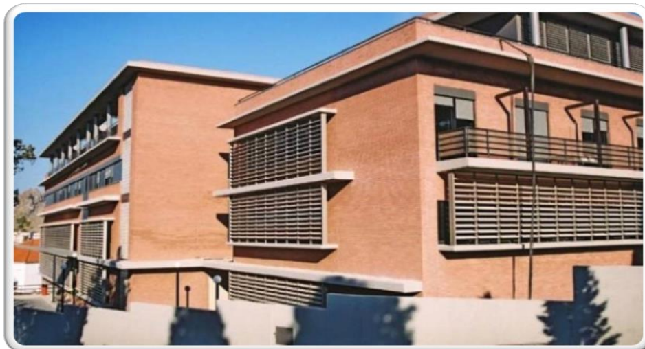
Εικόνα 13_Γενικό Νοσοκομείο Λήμνου

Στην πόλη της Μύρινας, λειτουργεί το Γενικό Νοσοκομείο Μύρινας (τηλ.: 22543 - 50400).