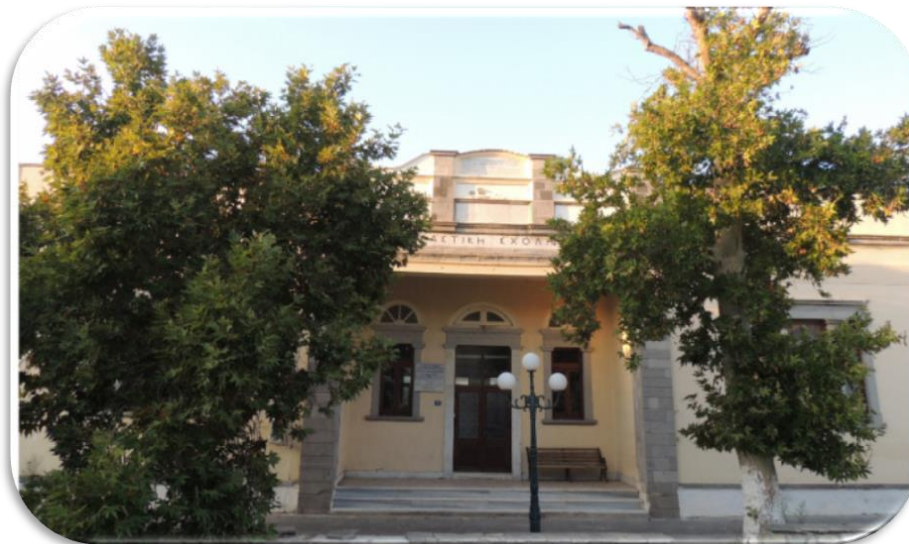
Εικόνα 14_1ο Δημοτικό Σχολείο Μύρινας

Στη ν. Λήμνο λειτουργούν σχολικές μονάδες που καλύπτουν τις ανάγκες προσχολικής, πρωτοβάθμιας και δευτεροβάθμιας εκπαίδευσης.