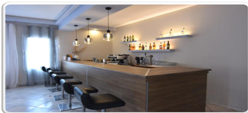
Εικόνα 5_Εσωτερική Όψη ΛΑΦ Μύρινας

Η Λέσχη είναι άρτια οργανωμένη και καλύπτει τις ανάγκες των στελεχών και των οικογενειών τους παρέχοντας καθημερινά, δύο επιλογές μαγειρευτών φαγητών, καθώς δυνατότητα παραγγελίας εδεσμάτων «της ώρας».