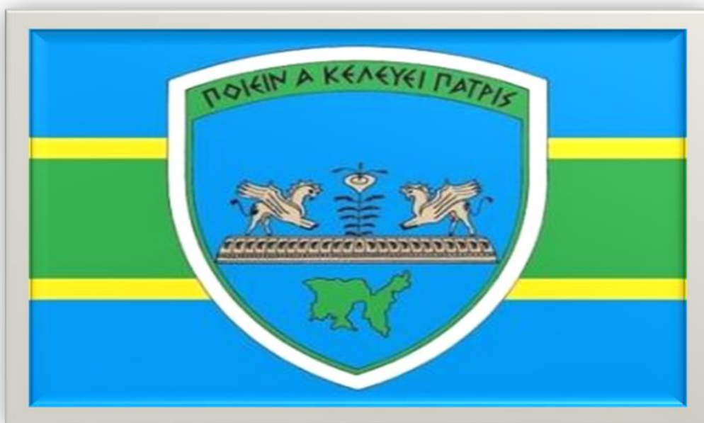
Εικόνα 3_ «ΠΟΙΕΙΝ Α ΚΕΛΕΥΕΙ ΠΑΤΡΙΣ»

Το έμβλημα της 88 Στρατιωτικής Διοίκησης απεικονίζει τη νήσο Λήμνο και δύο μυθικά τέρατα (γρύπες), που στην μυθολογία εμφανίζονται ως φύλακες θησαυρών, σχετίζονται με την επαγρύπνηση και την εκδίκηση - τιμωρία κάθε επίδοξου επιβουλέα και συμβολίζει την αποφασιστικότητα του Σχηματισμού για την προστασία της Νήσου.