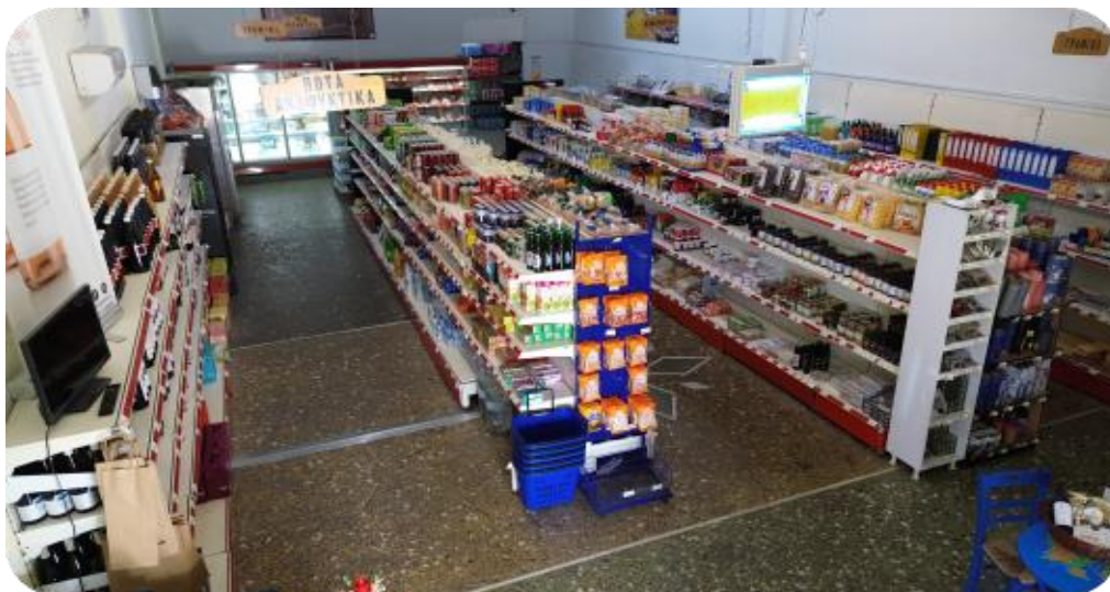
Εικόνα 8_Εσωτερικό ΣΠ Λήμνου

Το Στρατιωτικό Πρατήριο Λήμνου παρέχει είδη «super market» και στρατιωτικά είδη σε οικονομικές τιμές και επιπλέον παρέχονται εποχιακές προσφορές, αναλόγως της διαθεσιμότητας.