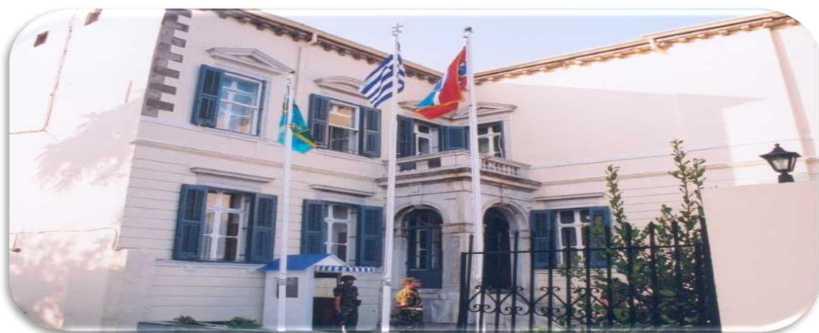
Εικόνα 1_Άποψη του Παλαιότερου Στρατηγείου της Ταξιαρχίας

Μέχρι το Φεβρουάριο 2005 το Στρατηγείο της Στρατιωτικής Διοίκησης, στεγάστηκε στο νεοκλασικής αρχιτεκτονικής διατηρητέο κτίριο, του Χριστοδουλίδειου Ιδρύματος στην περιοχή Ρωμέικος Γιαλός.