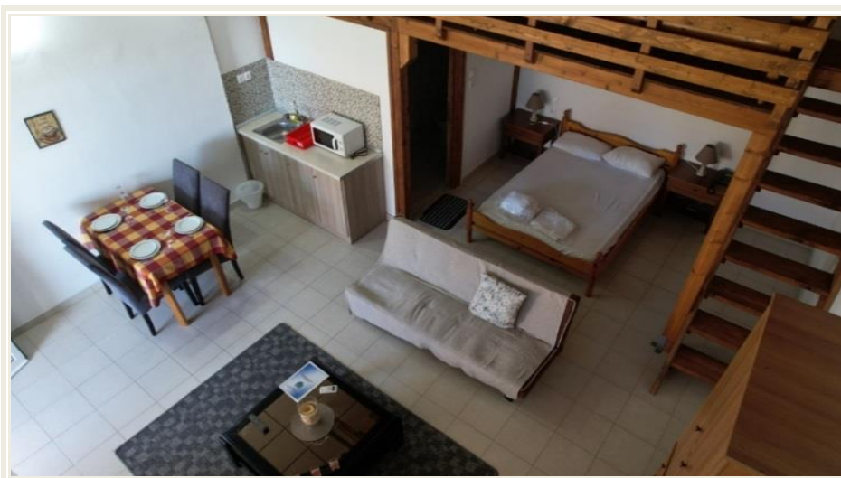
Εικόνα 10_Εσωτερική Όψη Ξενώνων 88 ΣΔΙ

Η διάθεσή των ξενώνων Φρουράς Λήμνου γίνεται, κατόπιν αίτησης του ενδιαφερόμενου προς την 88 ΣΔΙ/7 ο ΕΓ (τηλ.: 22540 - 85271) και έγκρισης της Ιεραρχίας της 88 ΣΔΙ.