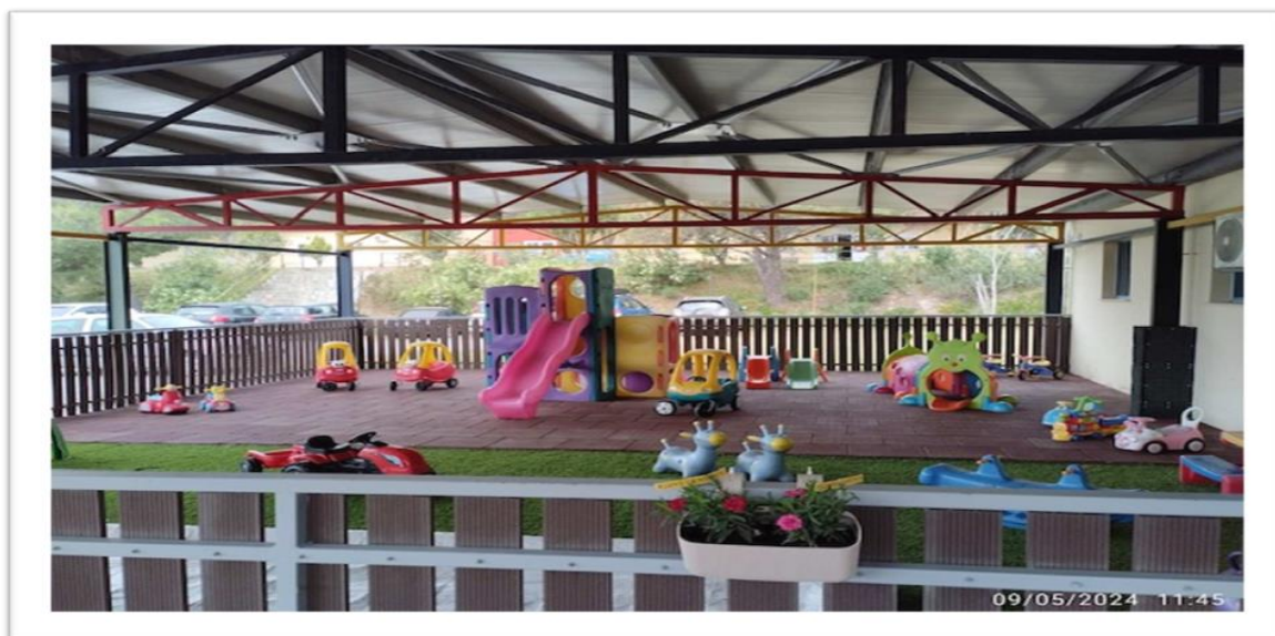
Εικόνα 12_Εξωτερική Όψη ΒΝΣ Φρουράς Λήμνου

Αιτήσεις υποβάλλονται από 1 Ιουνίου έως 10 Αυγούστου κάθε έτους στην 88 ΣΔΙ/1 ο ΕΓ. Η υποβολή των αιτήσεων από τους δικαιούχους είναι δυνατή και από τη Μονάδα που υπηρετούν, εφόσον έχει κοινοποιηθεί η μετάθεσή τους κατά το τρέχον έτος για τη Φρουρά Λήμνου.