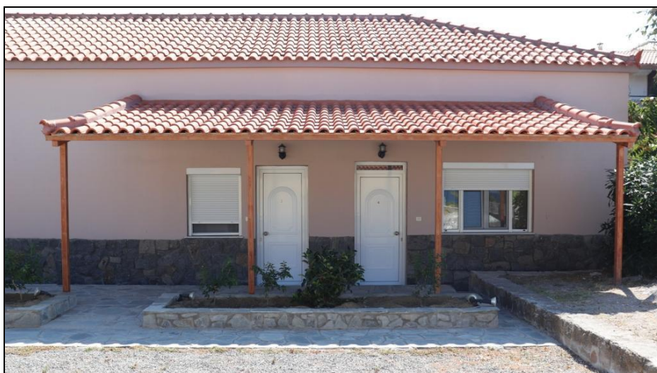
Εικόνα 9_Εξωτερική Όψη Ξενώνων 88 ΣΔΙ

Στο πλαίσιο της παροχής διευκολύνσεων τόσο σε στελέχη τα οποία εκτελούν διατεταγμένη υπηρεσία όσο και σε επισκέπτες - φιλοξενούμενους της 88 ΣΔΙ, λειτουργούν στην πόλη της Μύρινας και ειδικότερα στο Στρατόπεδο «ΑΝΘΛΓΟΥ ΤΣΙΜΟΥΡΗ» (εντός του οποίου βρίσκεται η ΛΑΦ ΜΥΡΙΝΑΣ και το ΣΠ ΛΗΜΝΟΥ), 4 ξενώνες και 1 ξενώνας ανωτάτων Αξιωματικών.