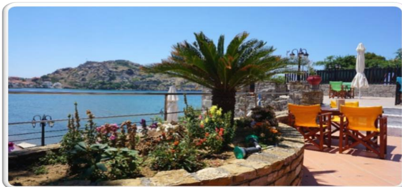
Εικόνα 4_Εξωτερική Όψη ΛΑΦ Μύρινας

Στη Φρουρά Λήμνου λειτουργεί μία Λέσχη (Στρατόπεδο «ΑΝΘΛΓΟΥ ΤΣΙΜΟΥΡΗ»), στην περιοχή «Ρωμικός Γιαλός» της πόλης της Μύρινας.